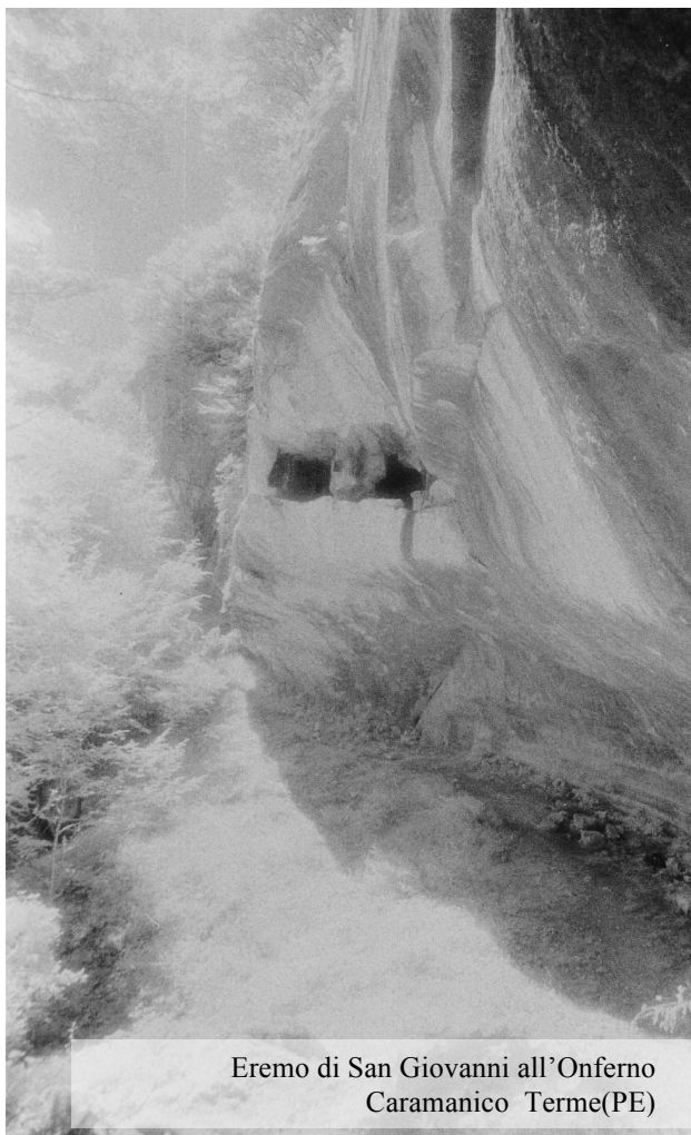
Eremo di San Giovanni all'Onferno Caramanico Terme(PE)